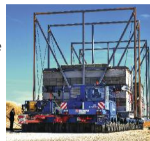
352 roues, 46 mètres de long, 9 de large, 11 de haut... et 800 tonnes de béton.

Chacun dans son rôle, l'Agence Iter France ; le transporteur Daher ; l'agence européenne pour ITER ; les autorités françaises (préfecture de région, gendarmerie, etc.) et ITER Organization, destinataire final du colis, ont accompli un sans-faute... qui devra être renouvelé plus de 200 fois dans les six années qui viennent. ●