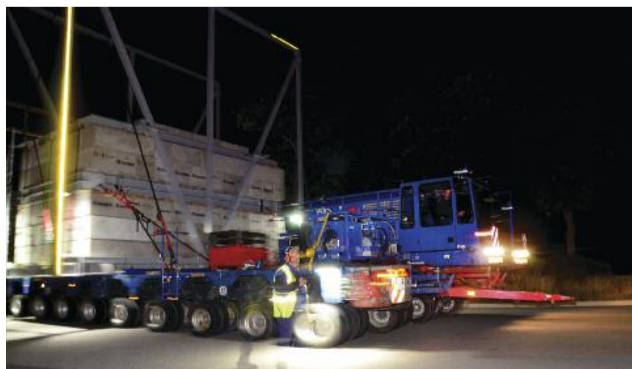
Il est un peu plus de 4 heures. La remorque passe le rond-point d'accès à ITER.